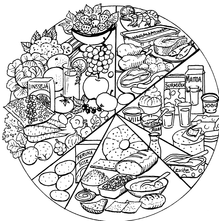
Ruokaympyrä (Valtion ravitsemusneuvottelukunta, 2004)

Ruokaympyrä kuvaa monipuolisuutta ja eri elintarvikeryhmien suhteellista osuutta ruokavaliossa. Päivittäiseen ruokavalioon tulisi sisällyttää jotain ruoka-ainetta jokaisesta ruokaympyrän lohkoista. Ruoan vaihtelevuus toteutuu kun lohkoista käytetään vaihdellen eri ruoka-aineita. Koottaessa päivittäistä ruokavaliota tulisi huomioida monipuolisuus ja värikkyys, sopivuus ja riittävyys sekä nautittavuus ja kiireettömyys.